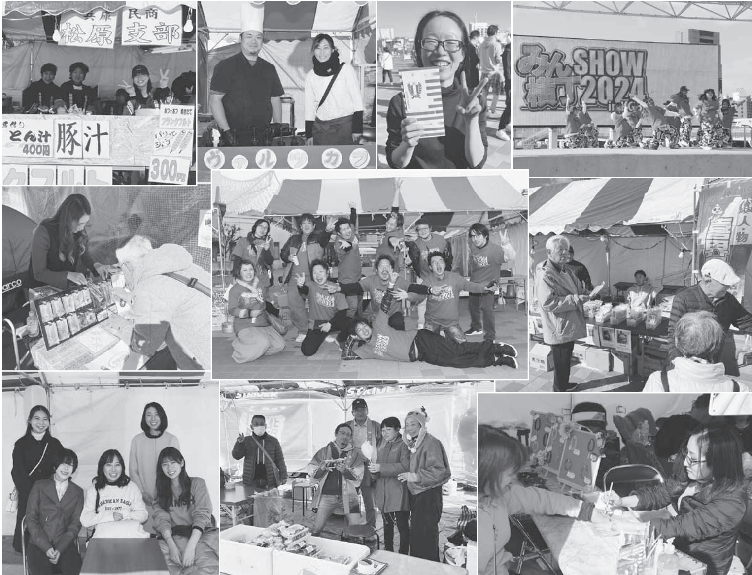
(みんSHOW横丁2024の記事は4面)