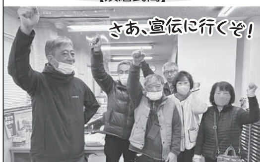
2月16日、須磨民商では、ビラ、リーフ、商工新聞宣伝紙を持って、役員・事務局員が宣伝行動。宣伝カーも走らせ、地域に民商を知らせました

「消費税5%以下への減税」「インボイス廃止」「マイナ保険証の強要を許すな」、さまざまな悪政が、国民、そして若者の政治離れにつながっていると思います。そんな若者に政治にもっと関心を持って欲しい。強く思った日になりました。