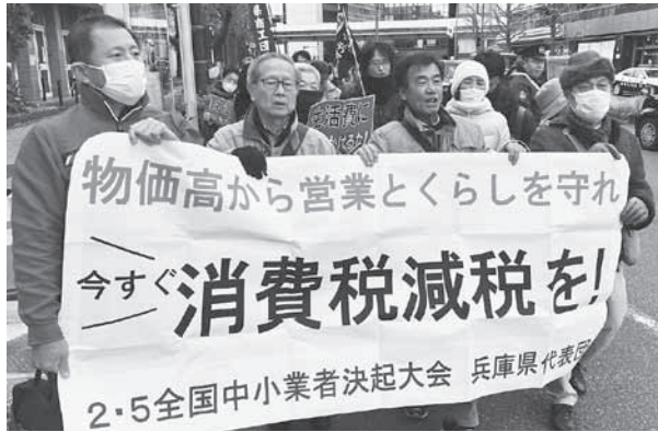
2・5全国中小業者決起大会 兵庫県代表

2月5日、東京・砂防会館で「物価高から営業とくらしを守れ、今すぐ消費税減税を！」をスローガンに全国中小業者決起大会が開かれ、全国各地から700人が集いました。